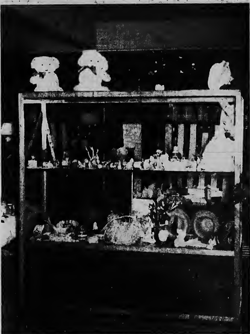
De showcase in Trocadero is smaakvol ingericht met souvenir-artikelen op Aruba vervaardigd. Het geheel biedt een interessant aanzicht.

den wij nooit voor mogelijk gehouden. Een boom val vogeltjes van kleurige schelpjes gemaakt, ook knoppen van tere witte schelpjes, een vaas met schelpenbloemen— een inzending van een moeder met enige kinderen, een vrouwtje in klederdracht met een mand fruit op haar hoofd, geheel uit schelpjes vervaardigd tot zelfs de miniatuur kleine vruchtjes toe; die was naar onze mening de mooiste inzending. Ook de textielafdeling blijft niet achter: gehaakte en gehoordeurde kleedjes, zakdoeken met ingewerkt kant, beschilderde strepdassen. Voorts waren er beschilderde tegelen een hele stapel schilderijen o.a. van de schilders P. Janssen en R. Ranselaar Jr.